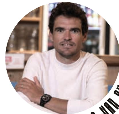
GREG VAN AVERMAET

“De Berendries is een van mijn favoriete beklimmingen in de Vlaamse Ardennen. Het is een helling die me als puncher perfect lag: niet super lang (circa 1 kilometer), maar met de nodige steiltegraad (gemiddeld 7%, met een piek tot 14%) en een vervelende uitloper waar je extra verschil kan maken. Dergelijke inspanningen van 1,5 à 2 minuten, die typisch zijn voor de Vlaamse klassiekers, waren me op het lijf geschreven. Ook de Valkenberg is zo'n helling met goed asfalt die uiterst geschikt is voor een korte, explosieve prikkel.”